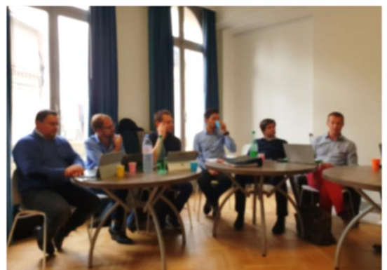
Journée de bilan avec la première promotion de dirigeants accompagnés en 2018/2019.