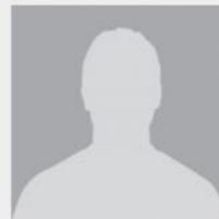
Sébastien HORNEBECQ Act'Emploi