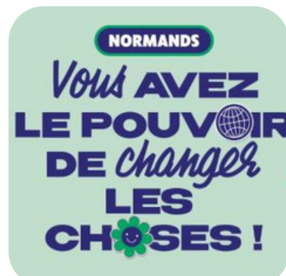
Fonds de financement participatif "Normandie en transition"