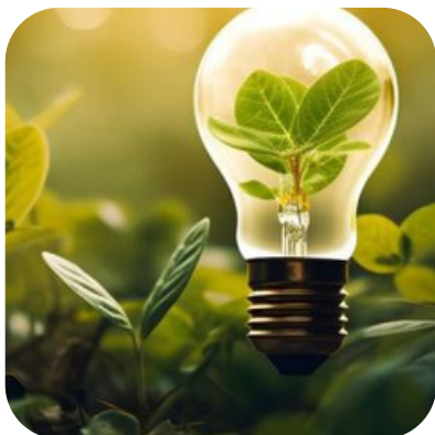
AMI Numérique pour le climat