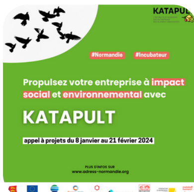
Appel à candidatures pour l'incubateur Katapult